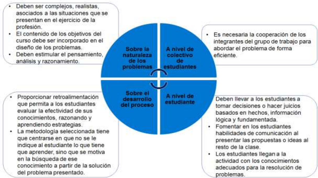
Figura 3 Características de ABP. Elaboración propia.

Es importante señalar, que aunque el estudio se hizo sobre la base de los trabajos de diploma, estas responden a situaciones reales de la empresa cubana.