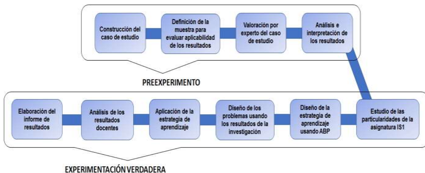
Figura 2 Etapas de la investigación experimental. Elaboración propia.

El experimento verdadero o puro diseñó los problemas de esta asignatura siguiendo los resultados obtenidos y evaluó el impacto en la calidad a partir de la evaluación final de los estudiantes en esta materia. En la figura 2 se presenta el esquema seguido en la preexperimentación y en la experimentación verdadera.