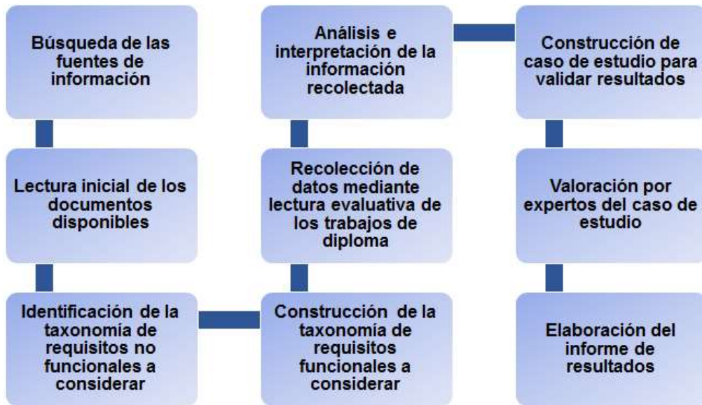
Figura 1 Etapas de la investigación documental. Elaboración propia.

producto de software. En la figura 1 se describen las etapas que se llevan a cabo, que toman como referencia la propuesta de (Arias, 2012) y que la adecúan a las particularidades de este estudio.